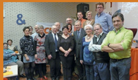
Yves Leterme omringd door mandatarissen en bestuursleden

Sinds enkele maanden verblijft hij in het Zweedse Stockholm. Hij is er de nieuwe